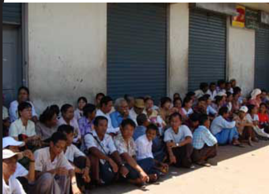
ဒေါ်အောင်ဆန်းစုကြည် မတရားအမှုဆင်ခံနေရသည့် တရားခွင်ကို လာရောက် စောင့်ဆိုင်းနေကြသော ပြည်သူလူထု။