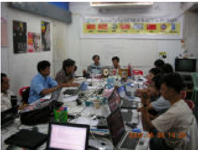
ဒေါ်အောင်ဆန်းစုကြည်အရေးအတွက် FDB ခေါင်းဆောင်များ စည်းဝေးနေကြစဉ်

ယခုလ ၁၉ ရက် နေ့တွင် မြန်မာနိုင်ငံဒီမိုကရက်တစ်အင်အားစု (FDB) ၏ မူဝါဒရေးရာဦးဆောင်အဖွဲ့နှင့် အတွင်းရေးမှူးအဖွဲ့၏ အစည်းအဝေးတစ်ရပ်ကို FDB ရုံးတွင် ကျင်းပခဲ့ပါသည်။ အဆိုပါ အစည်းအဝေးတွင် လူထုခေါင်းဆောင်ဒေါ်အောင်ဆန်းစုကြည်အား နအဖစစ်အုပ်စုမှ မတရား အမှုဆင်ပြီး အင်းစိန်ထောင်သို့ ပို့ကာ တရားစွဲသည့်အပေါ်တွင် ဖြစ်ပေါ်လာသည့် ပြည်တွင်းပြည်ပ နိုင်ငံရေးအခြေအနေများကို သုံးသပ်ဆွေးနွေးခဲ့ကြပါသည်။