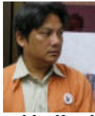
ဒေါက်တာနိုင်အောင် အတွင်းရေးမှူးချုပ် မြန်မာနိုင်ငံ

“နအဖသတင်းစာပါ ဖောက်ခွဲပျက်ဆီးမှုများနှင့်ပတ်သက်တဲ့ စွတ်စွဲချက်ကို ကျနော်တို့ မကဒတ (ကျောင်းသားတပ်မတော်)က ပြင်းထန်စွာ ကန့်ကွက်ပါတယ်။ ဒီနေ့ကာလ မြန်မာနိုင်ငံရေးအခြေအနေ အကြပ်အတည်းမှာ ဒေါ်အောင်ဆန်းစုကြည် လွတ်မြောက်ဖို့ ကျောင်းသား၊ ပြည်သူတွေရဲ့ လှုပ်ရှားမှုတွေ အရှိန်မြှင့်နေတဲ့အချိန်မှာ နအဖကိုယ်တိုင် မမှန်မကန်သတင်းတွေဖြန့်နေတာ၊ ခြိမ်းခြောက်အနိုင်ကျင့်နေတာတွေ ပြုလုပ်နေတဲ့အပြင် ပြည်သူလူထုကို အထိတ်တလန့်ဖြစ်အောင် လုပ်နေတာလည်းဖြစ်တယ်။ ဒါကြောင့် အများပြည်သူလူထုကြားမှာ အထိတ်တလန့်ဖြစ်အောင် ဖောက်ခွဲပျက်ဆီးမှုတွေ ဖြစ်လာရင် နအဖမှာသာ တာဝန်အရှိဆုံးဖြစ်တယ်။”