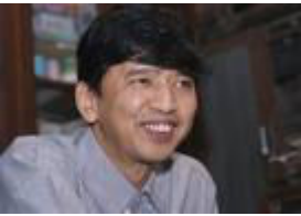
မေ ၁၈၊ ကိုရီးယား။